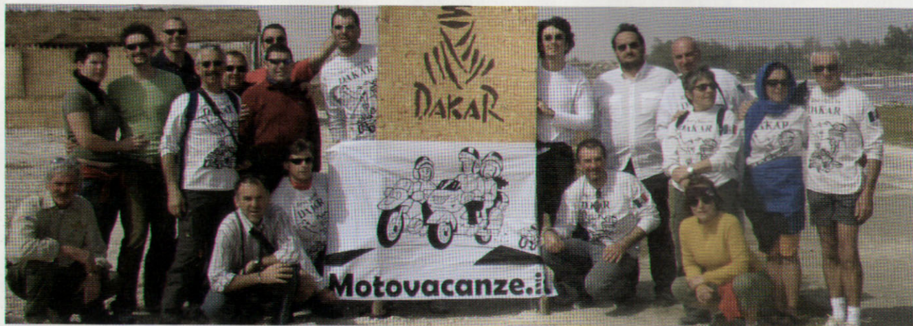
2006 - LAGO ROSA A DAKAR (SENEGAL) - FOTO DI GRUPPO MOTOVACANZE