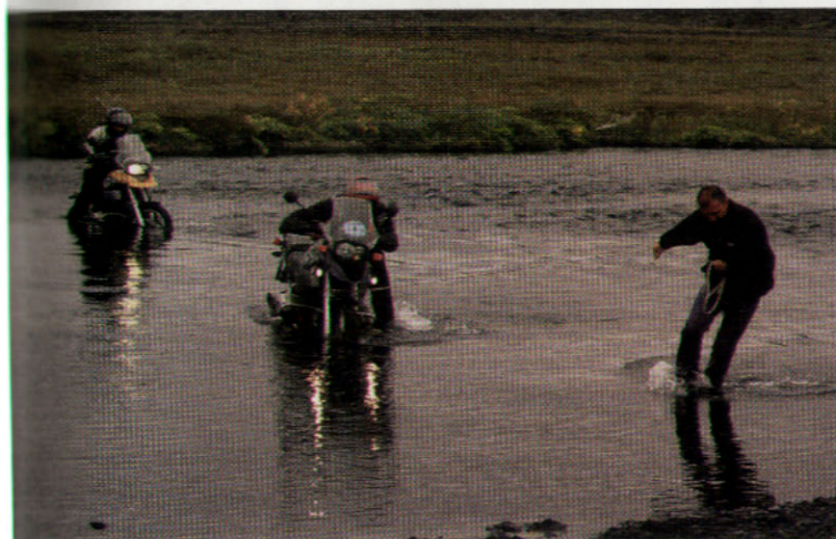
2009 - ISLANDA - AIUTO AD ALTRI MOTOCICLISTI IN UN GUADO VERSO LASKYA