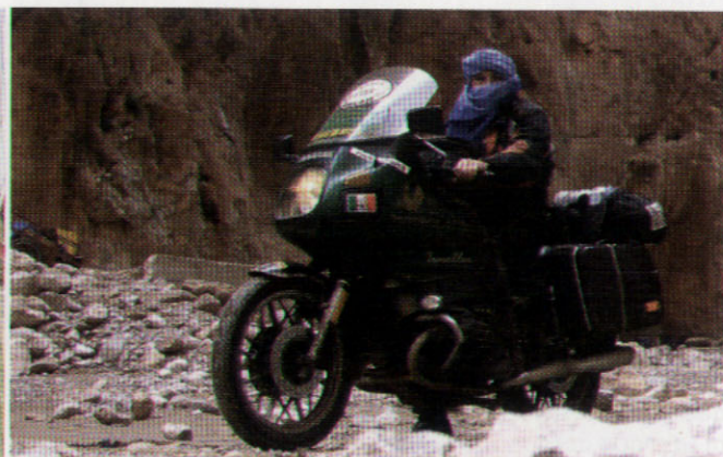
2006 - MAROCCO - GOLE DEL TODRA