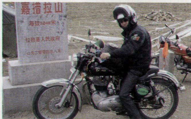
2011 - IN TIBET - PASSO A 5.250 METRI SUL LIVELLO DEL MARE