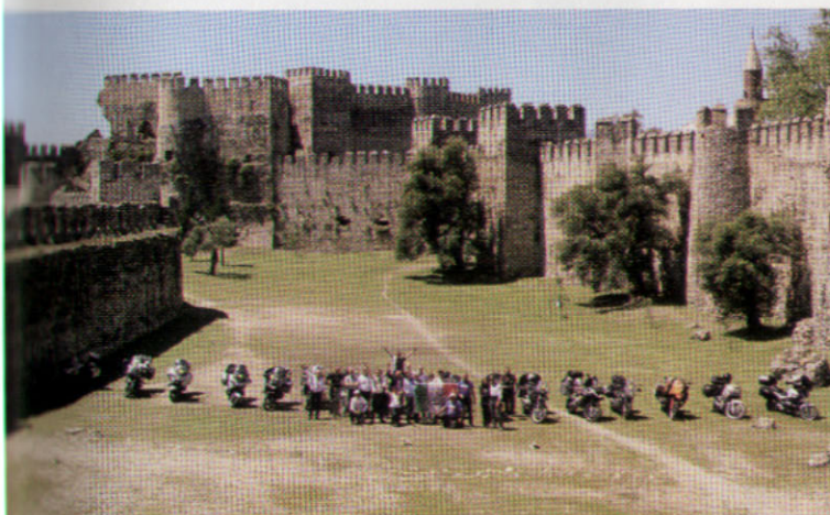
2013 - CASTELLO DI ANANURI - TURCHIA - VERSO L'IRAN E DUBAI