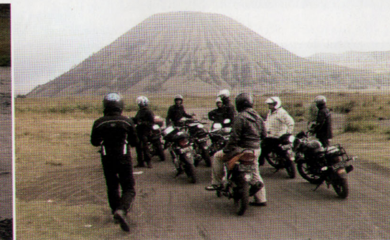
2010 - VULCANO BROMO - ISOLA DI JAVA - INDONESIA