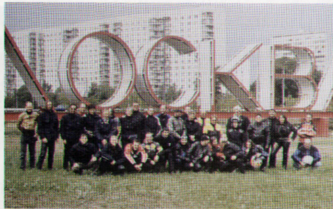
2002 - MOSCA - FOTO RICORDO DEL PRIMO GRUPPO "2000MOTO" IN RUSSIA