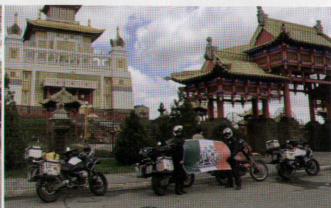
2017 - ELISTA (RUSSIA) - DURANTE IL SUO TERZO VIAGGIO FINO A SAMARCANDA