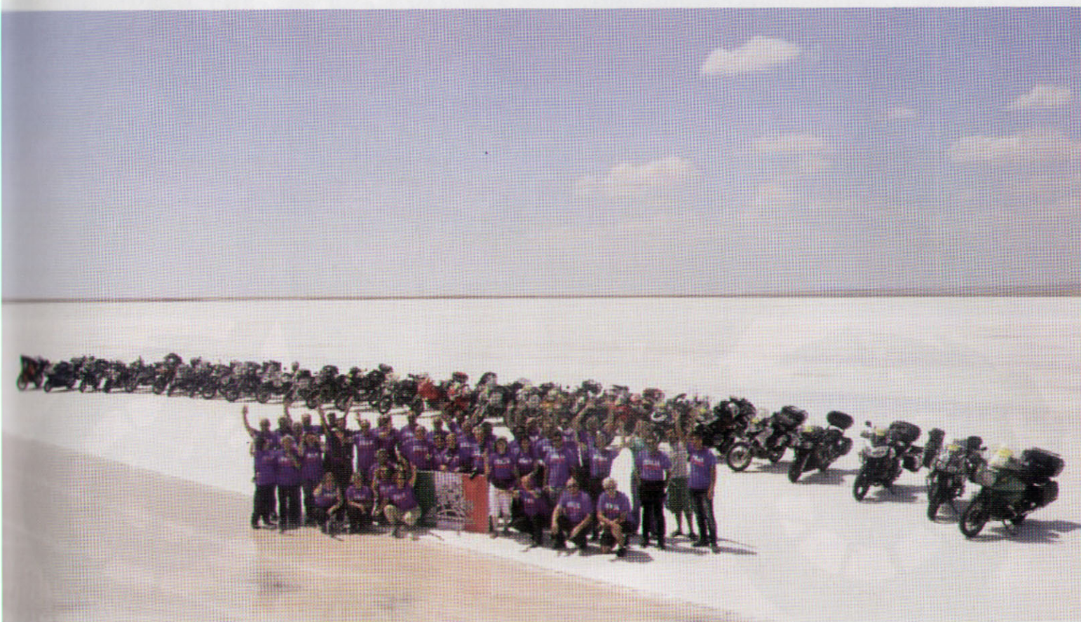
2012 - LAGO SALATO IN TURCHIA - FOTO DI GRUPPO MOTOVACANZE

Autore dei libri: I miei diari con la motocicletta (2018) Wildest East, road to Mongolia (2019) facebook: @dodidialen