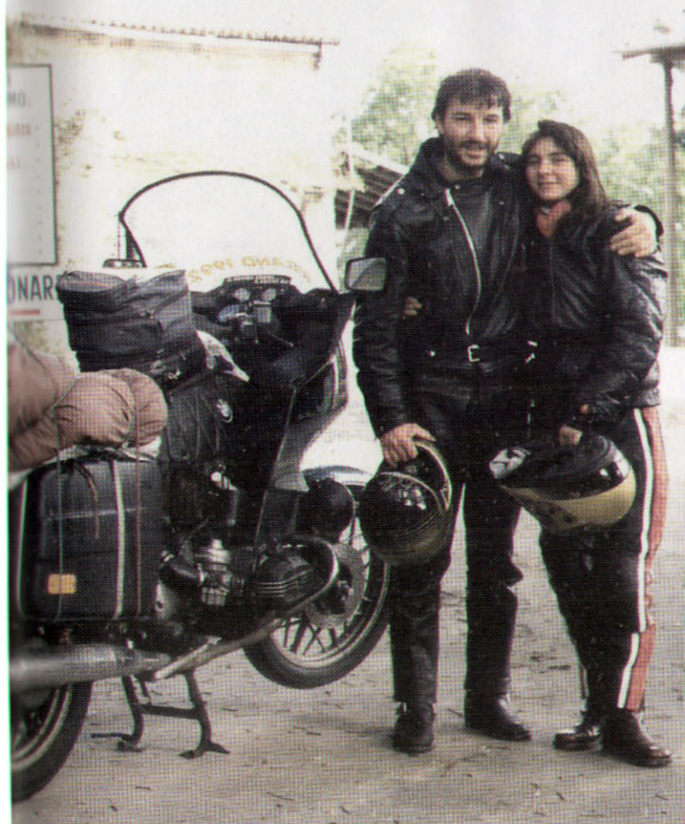
1993 - VERICA (MO) - AL RITORNO DA UN VIAGGIO IN SCOZIA (GRAZIE AL QUALE, CON UN FOTO-RACCONTO, VINSE IL PRIMO PREMIO DEL CONCORSO BMW UNA MOTO R800)