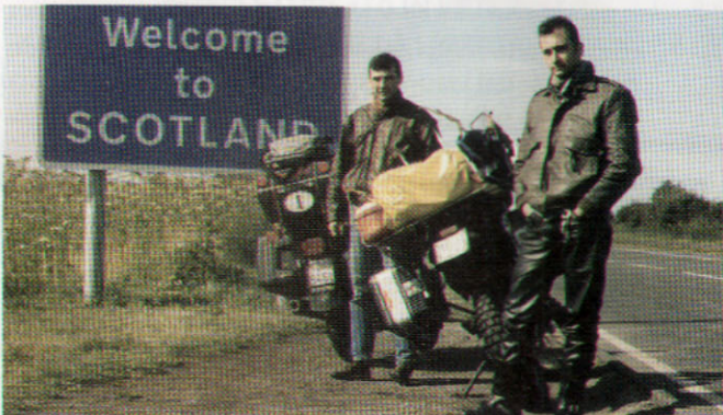
1991 - ARRIVO IN SCOZIA, CON L'AMICO POI SALUTATO A INVERNESS DOPO IL SUO INCIDENTE