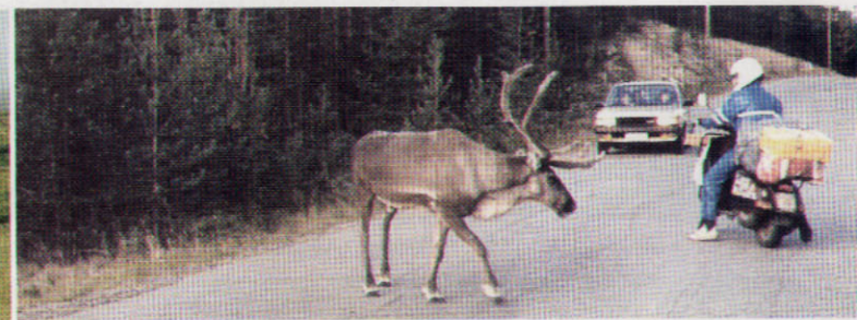
1983 - SVEZIA - L'AMICO VESPISTA ALLE PRESE CON UNA RENNA, AL RITORNO DA CAPO NORD