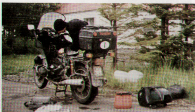
1992 - ISLANDA - RIPARAZIONE ALL'IMPIANTO ELETTRICO AD AKUREYRI