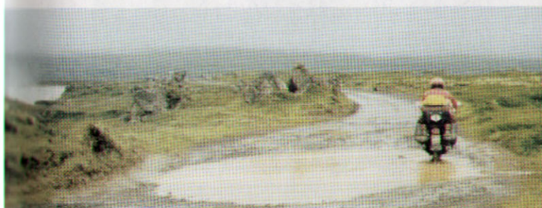
1992 - ISLANDA - STRADE STERRATE VICINO ALLA CASCATA DETTIFOSS

Per continuare a vivere in pace sui suoi monti al rientro dai suoi viaggi organizzati, sarà costretto ad alzare oltre 6 Km di recinti anti lupo. Nel contempo l'associazione Motovacanze ha raggiunto i 1000 soci e forse per invidia o gelosia "lupi ben diversi" lo attaccano e per 4 anni è costretto a difendersi e sostenere scontri legali infiniti, ma ne esce pulito e vincente: una battaglia combattuta più per principio che per altro. Continuano i suoi avventurosi viaggi e tours in tutto il Mondo, partecipa alla Biker Fest di Lignano Sabbiadoro nella storica area dedicata ai Grandi Motoviaggiatori dove presenta i suoi 2 libri di viaggi in moto. Forse prendendo spunto dal rivoluzionario Dr. Che Guevara, nel 2018 presenta un meraviglioso libro autobiografico di oltre 600 pagine "I miei diari con la motocicletta" (in cui anche noi veniamo citati e ringraziati) e nel 2019 pubblica "Wild East, il mio sogno di arrivare in Mongolia", due volumi ricchi di singolari esperienze di viaggio, belli da leggere ed esibire nella propria libreria personale. La moto che lo accompagna da anni e a cui è affezionatissimo è una BMW, una vecchia signora che potrebbe raccontare migliaia di avventure, senza sponsor »